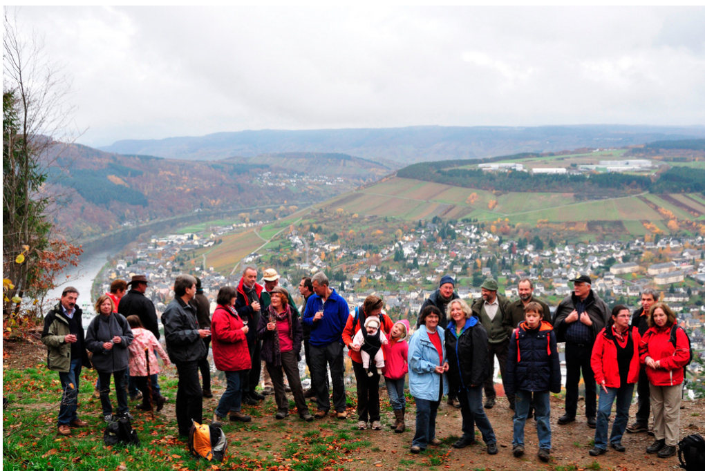
Die Wandergruppe des RCTT bei der Rast auf der Bismarckhöhe